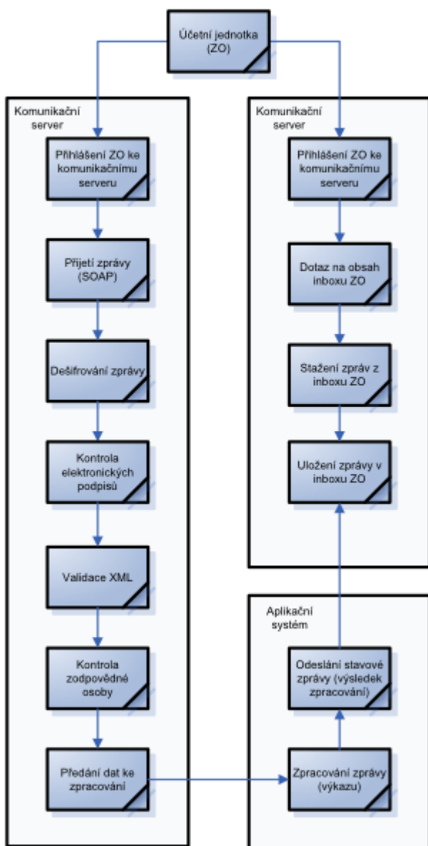
Obrázek 2: Schéma komunikace s CSÚIS

Komunikace účetní jednotky směrem do CSÚIS probíhá formou zasílání dat přes komunikační kanál. Všechna data, jež CSÚIS zasílá účetní jednotce, jsou uložena v Inboxu ZO. Výpis zpráv v Inboxu ZO a získání jejich obsahu je uživateli (ZO) přístupné voláním vyhrazených webových služeb pomocí stejného komunikačního kanálu CSÚIS. Systém CSÚIS tedy nikdy aktivně nenavazuje žádné spojení se systémy účetní jednotky. Pro uživatelskou („manuální“) komunikaci je vytvořeno uživatelské rozhraní v prostředí Webové aplikace , pomocí které lze zasílat připravená data do CSÚIS a rovněž přistupovat k datům (např. stavovým zprávám) uloženým v Inboxu ZO. Bližší popis naleznete v kapitole Webová aplikace .